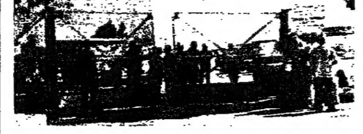
بوابة مصفاة طرابلس مغلقة

طرابلس - ممن مكتب « الانوار » : اتهم اصحاب صهاريج نقل البترول وشركته عن التراب من مصفاة البترول في طرابلس طيلة تجميع امس ، وذلك ردا على توقيف تجميع الشاحنات بكباس التراب من شكا الاول ، في رسالة مطرفة من بعد ظهر امس